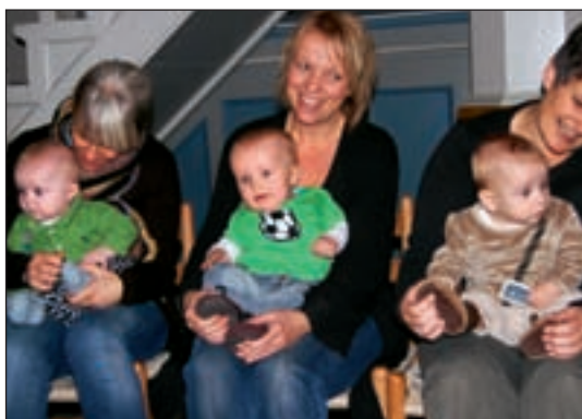
Babysalmesang til stor glæde...