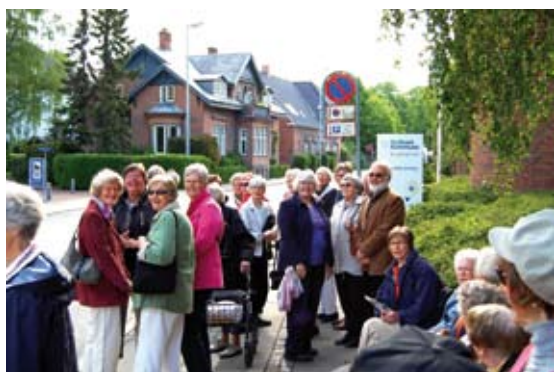
Eftermiddagshøjskolen sluttede sæsonen med en udflugt til Valby