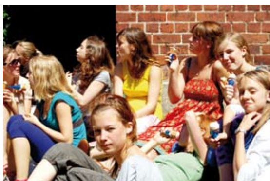
Et par af kormedlemmerne afsluttede sæsonen med at spise kæmpe is foran kirken.