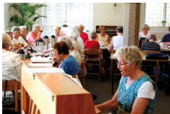
Elises Torsdagscafe er i fuld gang hver torsdag hele sommeren.