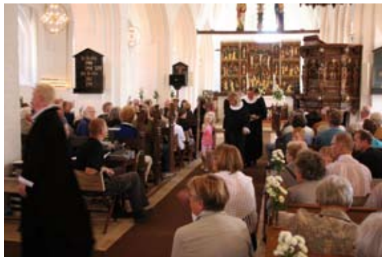
Jazzgudstjenesten 12. maj i Holmstrup Kirke blev et tilløbsstykke.