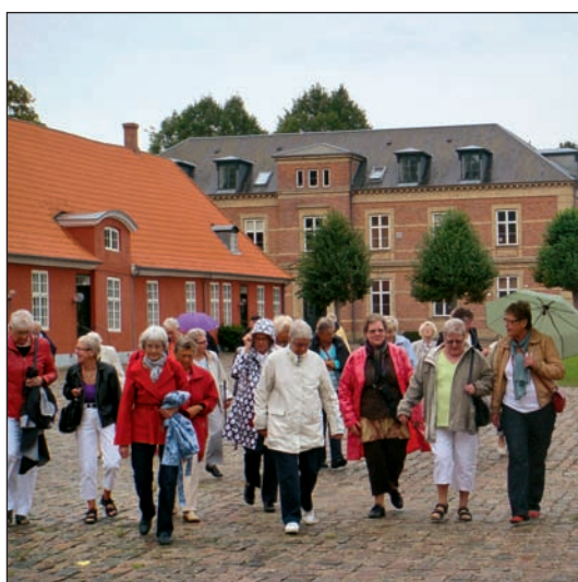
Onsdagscafeen på udflugt...