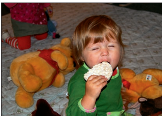
Børnekirke giver appetit...