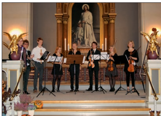
Unge holder koncert...